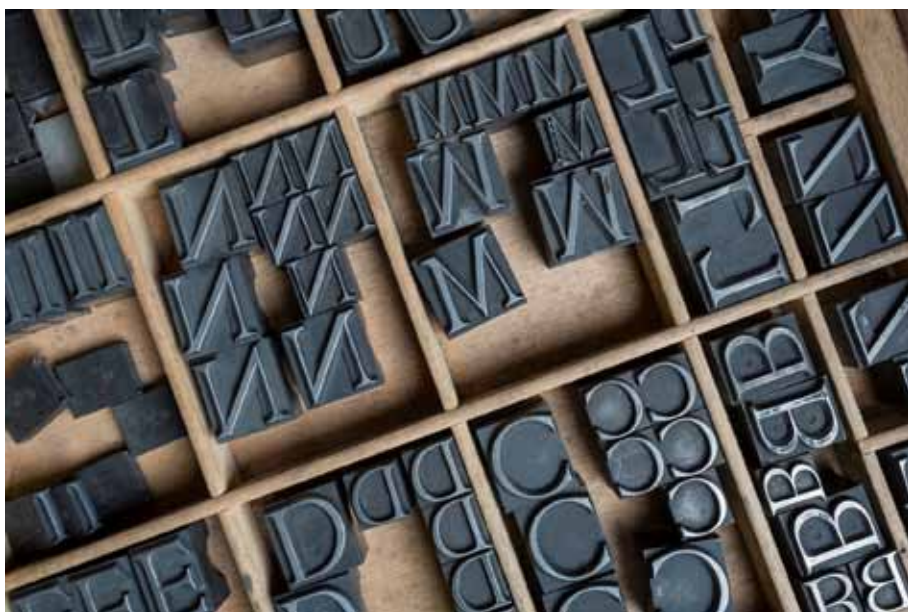
Atelier della casa editrice Tallone: particolare della cassa tipografica contenente due corpi da titolo del carattere "Iniziali Aldo Manuzio"

Nebiolo in una stagione di sperimentalismo grafico che non ha eguali. Tra questi, Semplicità (1928), Neon (1935), sino all'accentuata verticalità dell'Hastile disegnato da Alessandro Butti (1941).