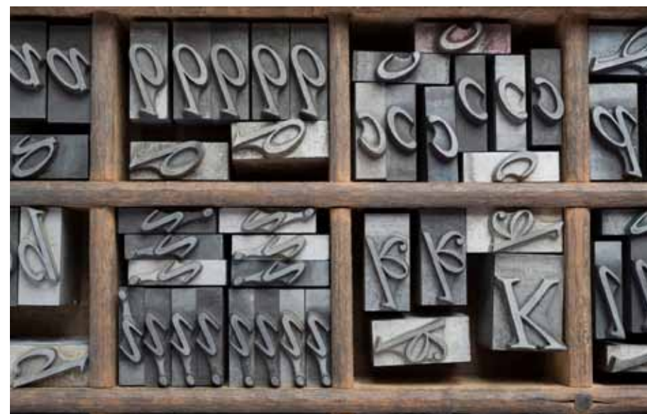
Atelier della Casa editrice Tallone: cassa di corsivi aldini