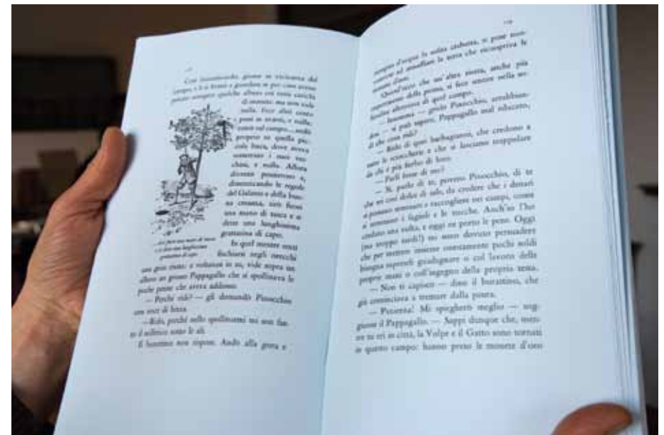
Le avventure di Pinocchio volume esposto in mostra, su carta di puro cotone delle Manifatture di Sicilia

soli 60 esemplari numerati, rappresenta a buon diritto un monumento dell'arte della composizione, dato il complesso studio e le numerose prove necessarie per impaginare i testi (composti a mano con i venerandi caratteri corpo 16 e 24 incisi da William Caslon e fusi nelle matrici originali settecentesche), la musica gregoriana (anch'essa composta a mano dall'editore Tallone, il solo al mondo a utilizzare i tipi mobili gregoriani originali, incisi a mano da Théophile Beauvoire nella seconda metà dell'Ottocento) e le incisioni di Parmiggiani. Il risultato, generosamente offerto agli occhi del visitatore, è quello che «Le Monde» ha definito un hommage à la civilisation de l'Europe . Un volume che unisce infatti initiative et des papiers Italiens, des textes Français, des encres allemandes et des caractères Anglais . Le poesie in lingua inglese di Emily Dickinson (2017) si offrono al lettore in un rinnovato volume nel formato 8° oblungo composto a mano con il carattere Tallone disegnato da Alberto Tallone e inciso a mano su punzoni d'acciaio da Charles Malin a Parigi alla fine degli anni Quaranta del secolo scorso. Frutto di altrettanto meditata composizione, che rispecchia le cadenze sommesse della poetessa inglese, l'edizione è impressa in 300 esemplari, 40 dei