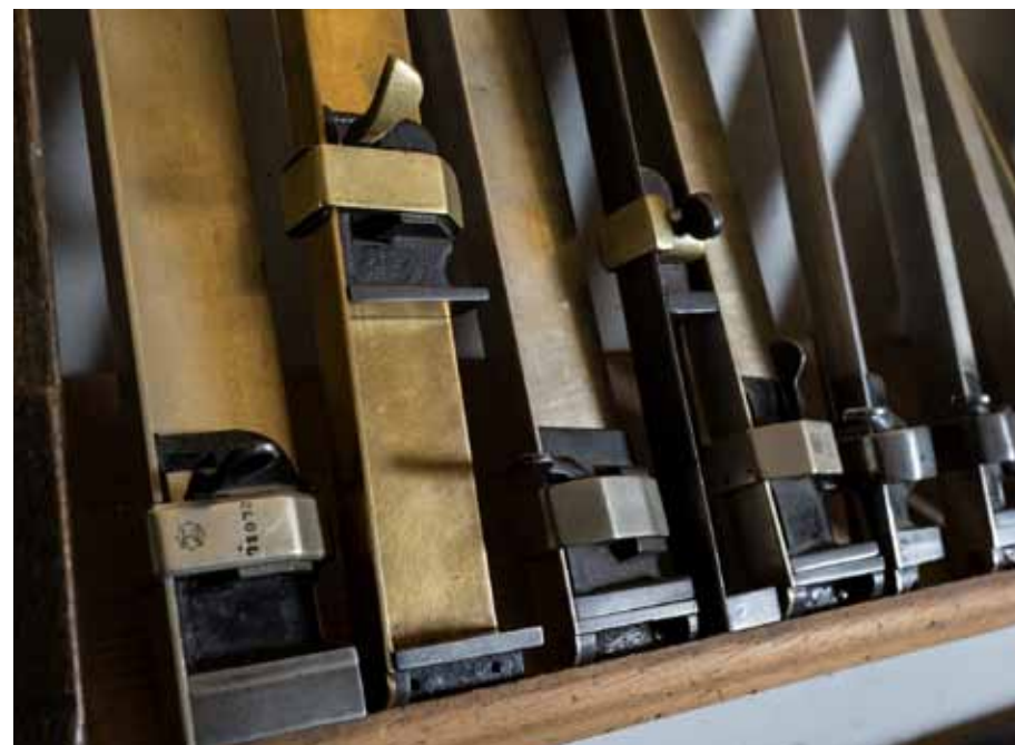
Compositoi tipografici pronti all'uso

Oltre al valore del contenuto letterario e dell'apporto filologico ai testi, le edizioni Tallone sono rinomate per il contributo stilistico al design del libro, attraverso i tipici formati oblungi, la chiarezza dell'impaginazione e il proprio carattere Tallone®. La singolarità della Casa editrice consiste altresì nel riunire le figure dell'editore e dello stampatore secondo il concetto della bottega rinascimentale, facendosi continuatore della tradizione della chiarezza grafica e intellettuale dei maestri Aldo Manuzio e Giambattista Bodoni.